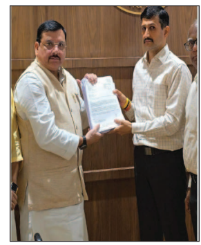
महाघोटाला हुआ है।

उन्होंने कहा कि महाघोटाले से जुड़े सबूत दस्तावेजों के रूप में एसआईटी को सौंप दिए गए हैं जिस पर कार्रवाई का भरोसा दिलाया गया है। अब देखते हैं कि क्या कार्रवाई होती है। उन्होंने कहा कि अयोध्या में भगवान श्रीराम के नाम पर